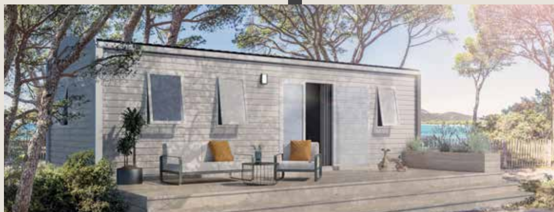
Le modèle familial