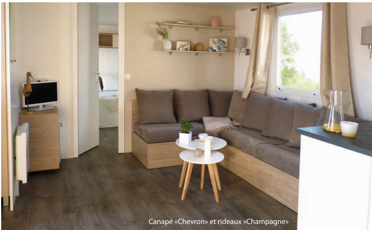
Canapé «Chevron» et rideaux «Champagne»